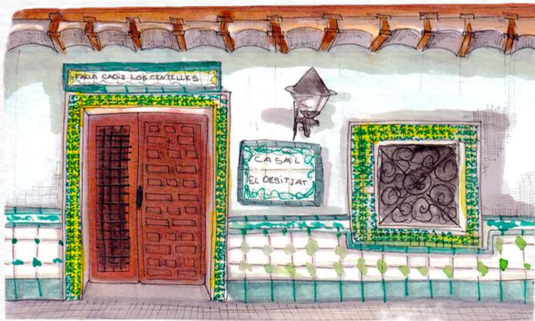
Fragments of everyday architecture and spaces of popular sociability.