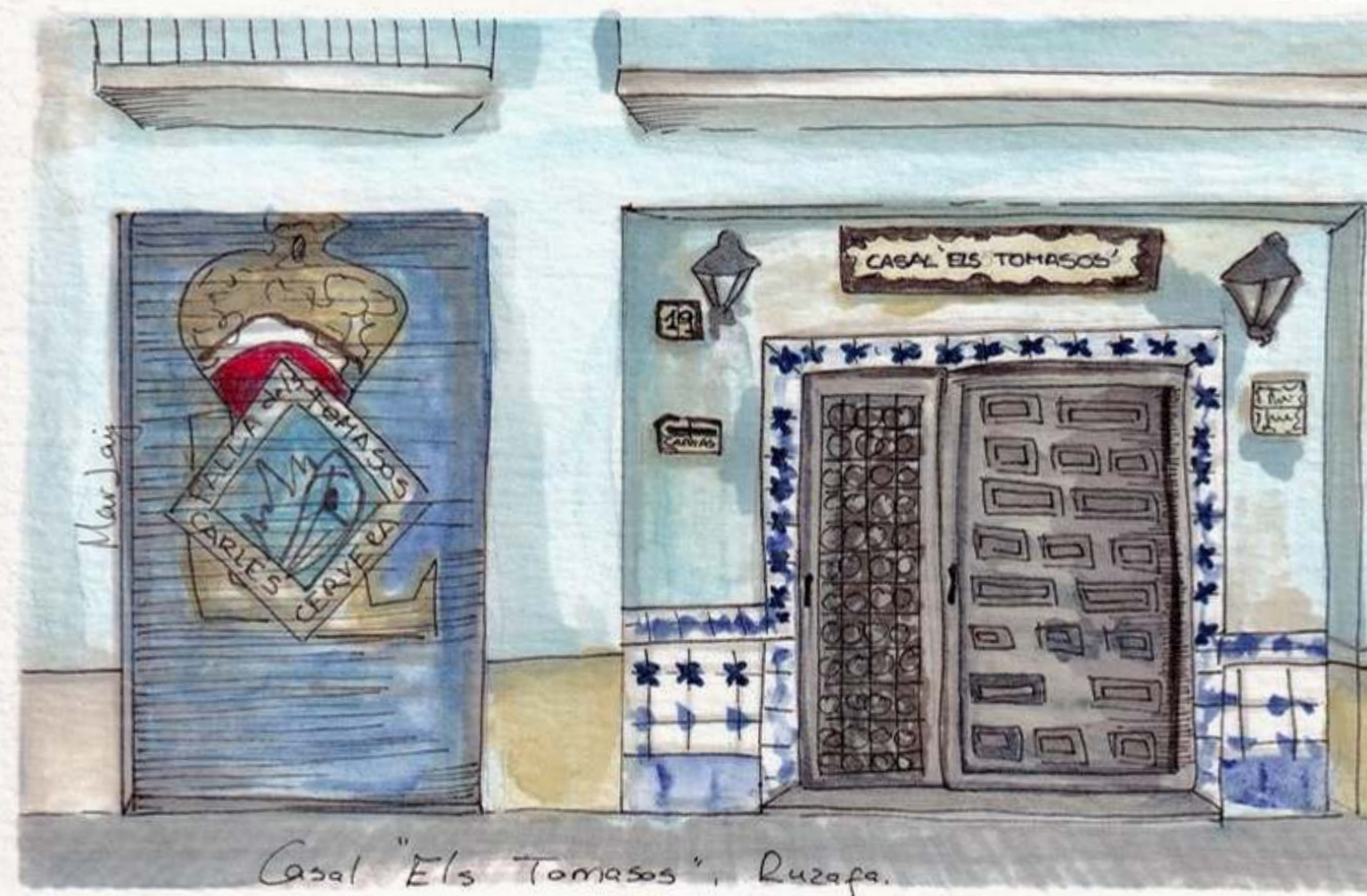
Casal "Els Tomasos", Ruzafa.