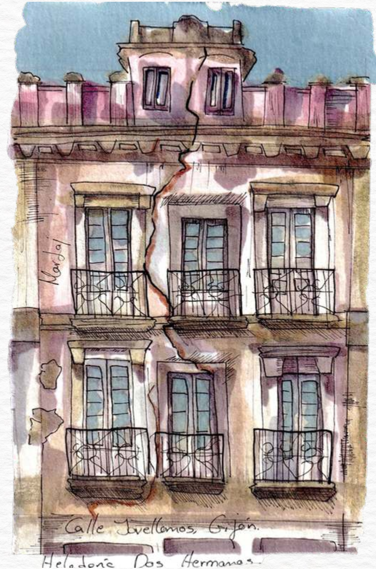
Calle Jovellanos, Gijón

Mi práctica combina técnicas analógicas y digitales, integrando acuarela, tinta y dibujo lineal para generar piezas que oscilan entre el cuaderno de viaje, el archivo arquitectónico y la memoria íntima de los espacios habitados.