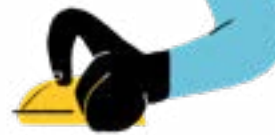
'WELCOME, Open day' Ilustraciones aplicadas a torres informativas e infografías para el centro Cliente: CEU UCH , Universidad Cardenal Herrera of Valencia