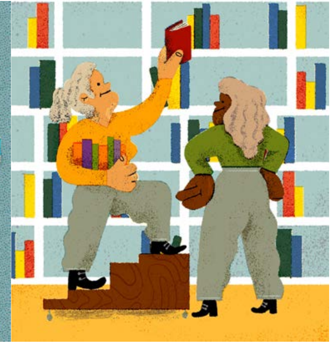
Left: 'Choosing the correct pantone' Right: 'The bookstore' Personal, 2021