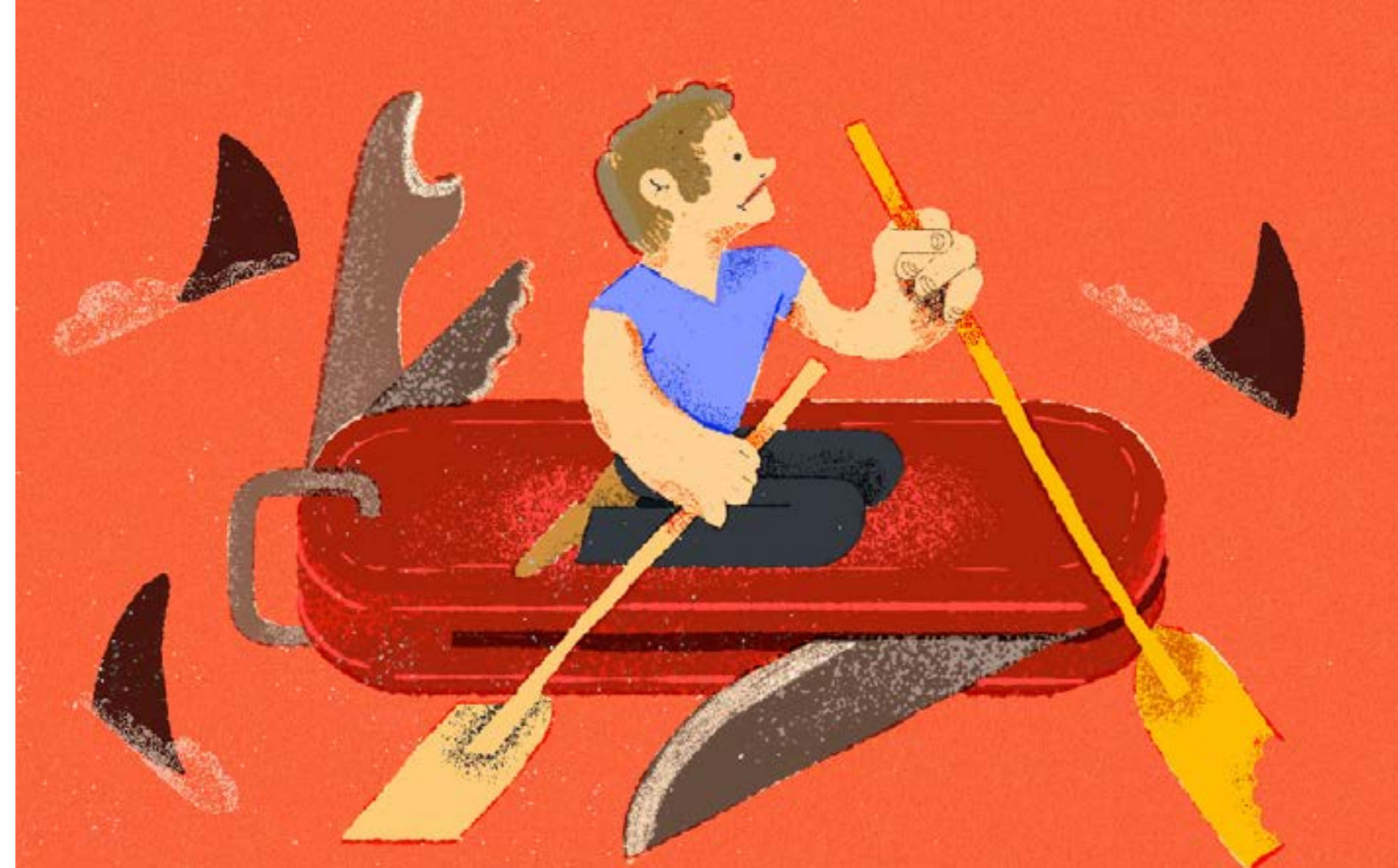
'Naufragio en tierra firme' Cabecera. Cliente: Periodismo de Barrio, 2021