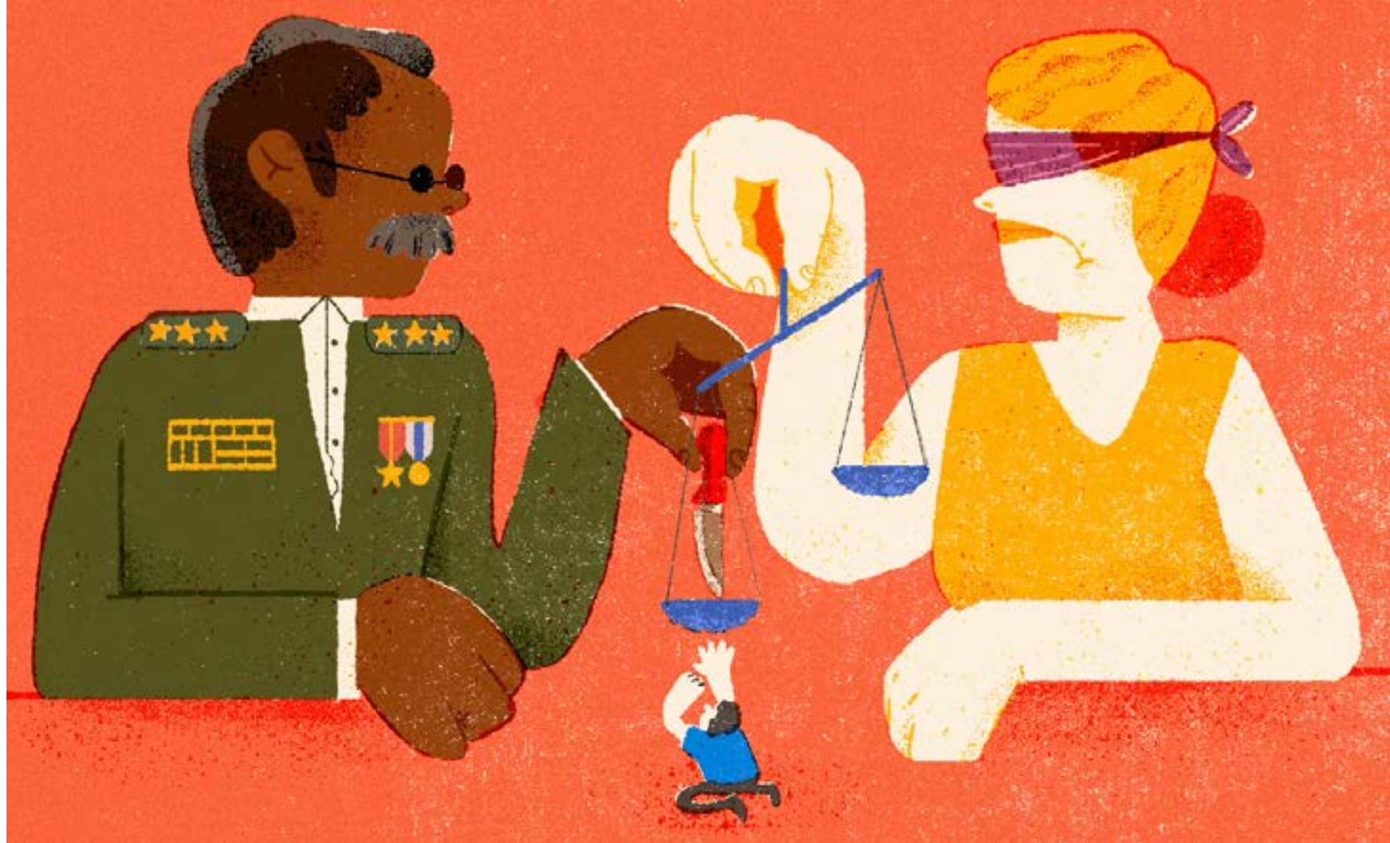
'Naufragio en tierra firme' Cuerpo. Cliente: Periodismo de Barrio, 2021