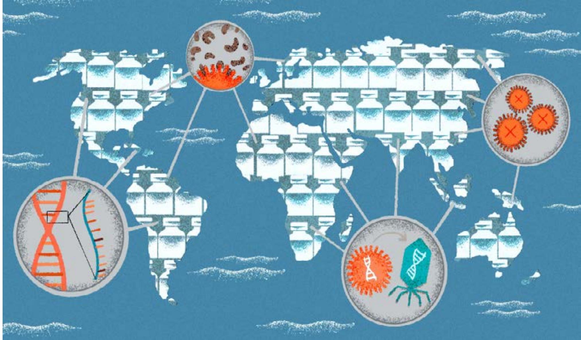
'Mapa de la vacunación; America Látina, el Caribe y el caso Cuba' cabecera.