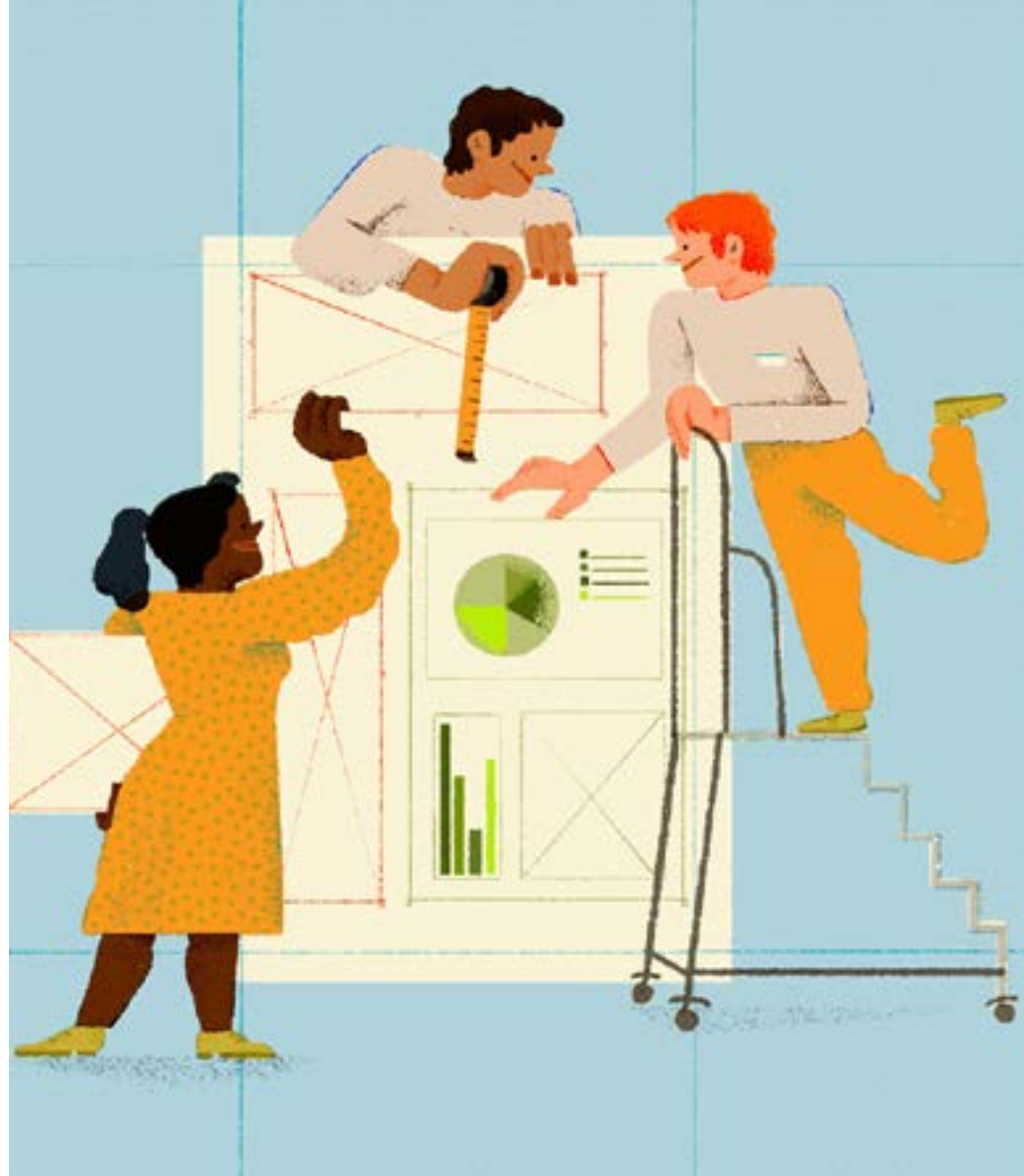
'Technicalities & fundamentals of typography and graphic design' Personal, 2021