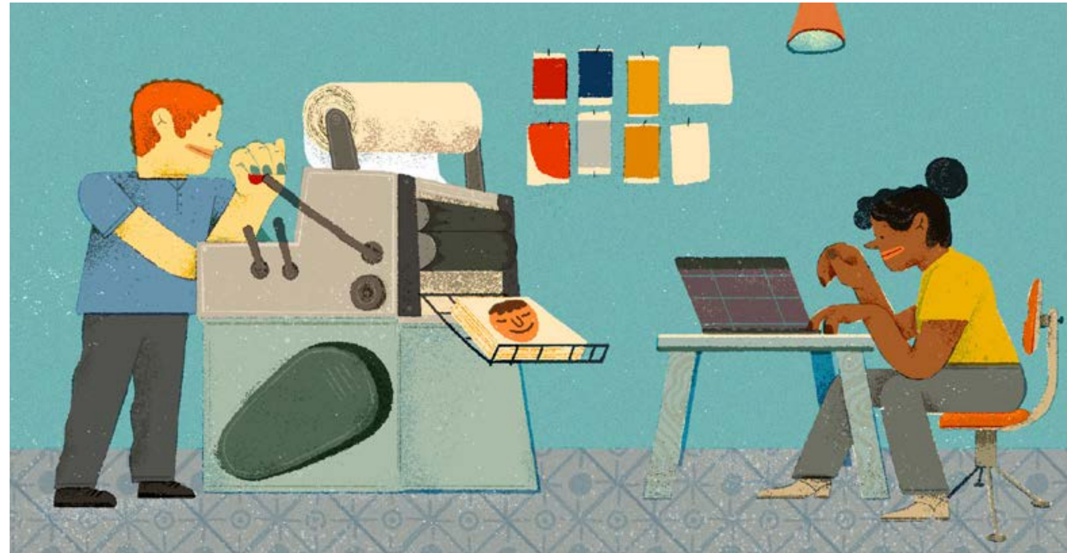
'The vacation of self-employed' Personal, 2021