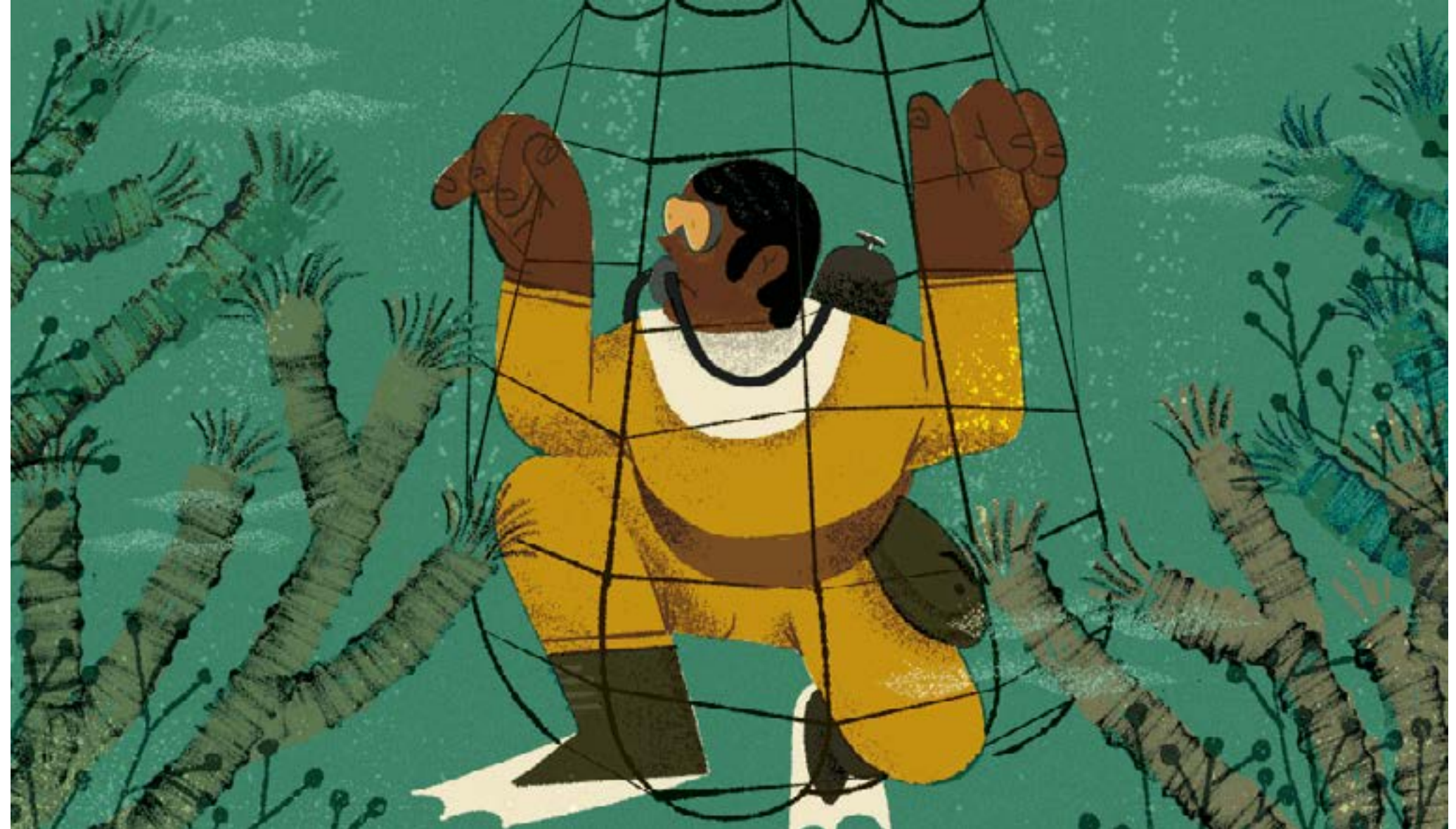
'Ahogarse fuera del agua' Cabecera. Cliente: Periodismo de Barrio, 2021